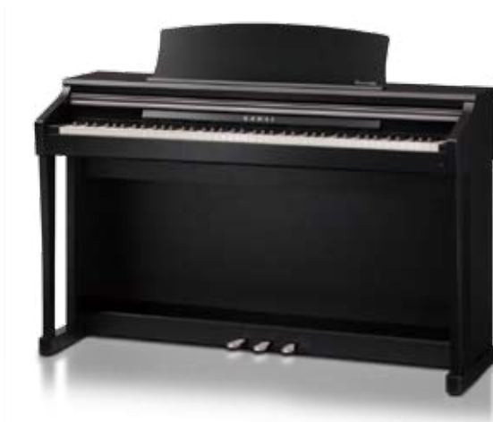
Nero Satinato Premium