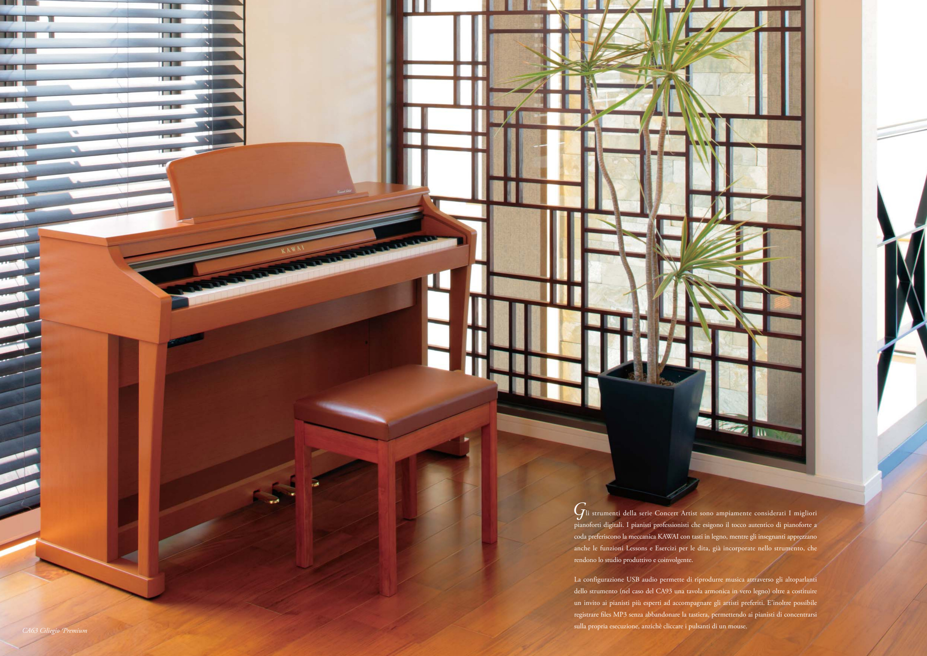
CA63 Ciliegio Premium

Gli strumenti della serie Concert Artist sono ampiamente considerati I migliori pianoforti digitali. I pianisti professionisti che esigono il tocco autentico di pianoforte a coda preferiscono la meccanica KAWAI con tasti in legno, mentre gli insegnanti apprezzano anche le funzioni Lessons e Esercizi per le dita, già incorporate nello strumento, che rendono lo studio produttivo e coinvolgente.